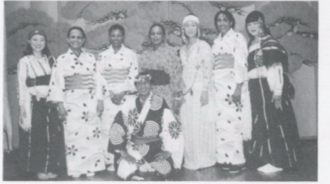
菊の会スタジオを訪れたチェニシア民族舞踊団

▼チェニシアから 民族舞踊団が訪れる 科学万博に参加するため日本を訪れたチェニシア民族舞踊団が、六月八日菊の会スタジオを訪れました。踊りをおして心はたちまち通じ合い、衣裳を取りかえるなど交歓会は最高に盛り上りました。 同行したイラク大使館のカーヒー公使が、この時の感想(要点を次のように述べています。 「あの日の歓迎会で見た日本の民族舞踊はとてすばらしかった。若い舞踊家達の洗練されたそして迫力ある踊りの中に、日本文化の奥行きが深さ、日本人のやさしさがこもっているような気がした。皆と一緒に、私