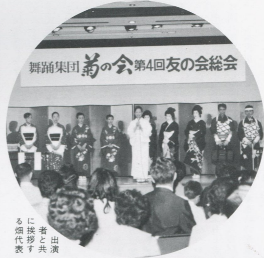
出演者と共に挨拶する畑代表