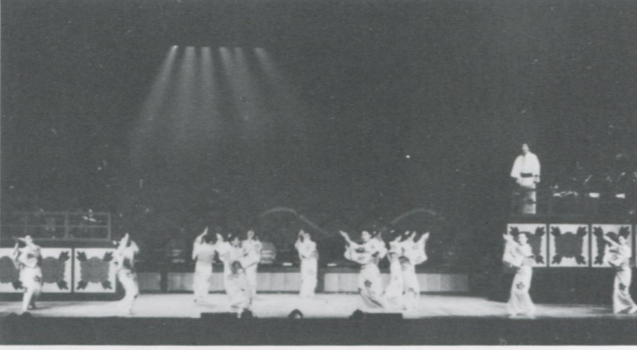
国立劇場大ホールでの平家踊

二十三分を菊の会のメンバーが踊りました。本條会の会員は数千人といわれております。近年、愛好者が急速にふえてきているそうです。厚い会員層の中から選ばれて今出演した方々の熱演に合わせた花を添えた舞台は、観客の目を充分楽しませることが出来ました。 菊の会のメンバーも久し振りに、国立劇場で伸び伸びと踊ることが出来た収穫は、とても大きかったといえましょう。 主な演目は、黒田節、郡上踊、原宿盆歌、平家踊、荒踊、西馬音内盆踊、東山盆踊、阿波踊。