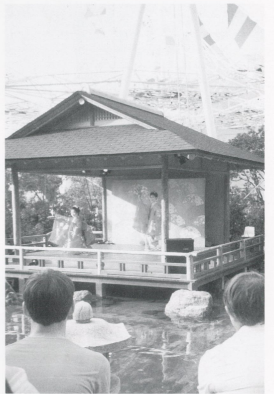
日本庭園の舞台上で踊る「鶴亀」

88国際レジャー博覧会(エキスポ88)は文字通り、世界中の国々から多種多様な人々が集まる場です。そこで日本を代表しての文化紹介とあって、私達一行は大いに緊張しました。お蔭様で日本のスタッフの方々が現地でお世話になった沢山の皆様のご協力が無事5日間(1日3回公演)の舞台を勤めることが出来ました。私達が現地にいったのはオープンの4日前で