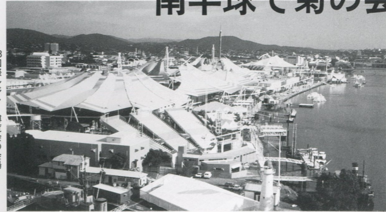
88国際レジャー博覧会の会場