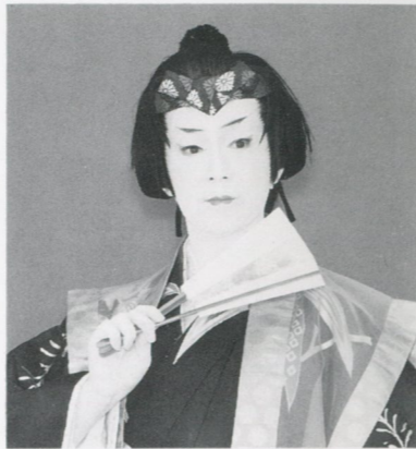
元禄花見踊り姿の畑代表

若葉輝く好季節となりました。皆様にはお変わりもなくお元気にお越しの事と存じます。菊の会創立十七周年の年頭はマレーシア公演で開幕いたしました。その折には、日野、埼玉県大井町、鹿島と記念公演を盛会に行う事が出来、その結果、お蔭様で、マレーシア