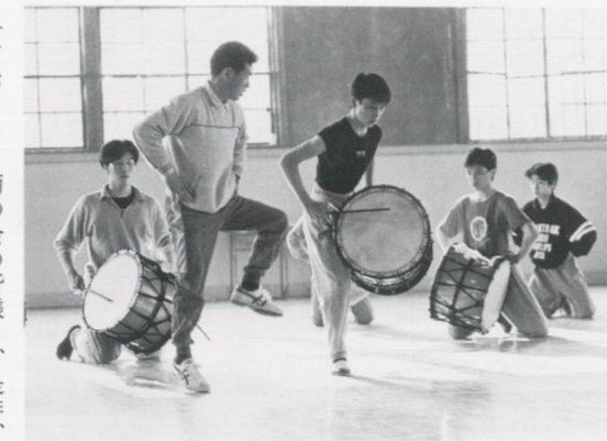
雌鹿の動作を教わる

私達も、後継者の育成には頭を悩ませております。若い人達には目標が必要だと思ひ、毎年秋に行なわれていた「全国青年芸能大会」に出場しております。昨年の第30回大会では、お蔭様で優勝する事が出来ました。